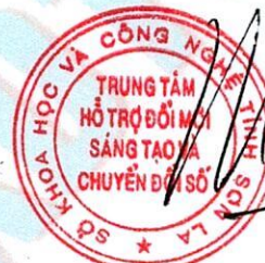
Đỗ Mạnh Thắng