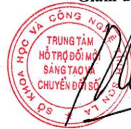
Đỗ Mạnh Thắng