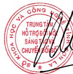
Đỗ Mạnh Thắng