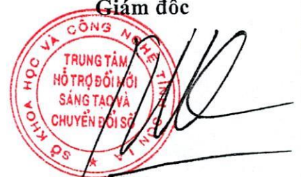
Đỗ Mạnh Thắng