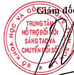
Đỗ Mạnh Thắng