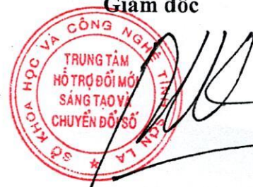
Đỗ Mạnh Thắng