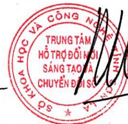
Đỗ Mạnh Thắng